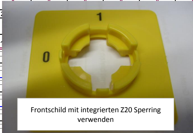
Frontschild mit integrierten Z20 Sperring verwenden