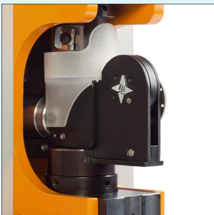
profilierte, selbsteinstellende Crimpflächen profiled, self adjusting jaws