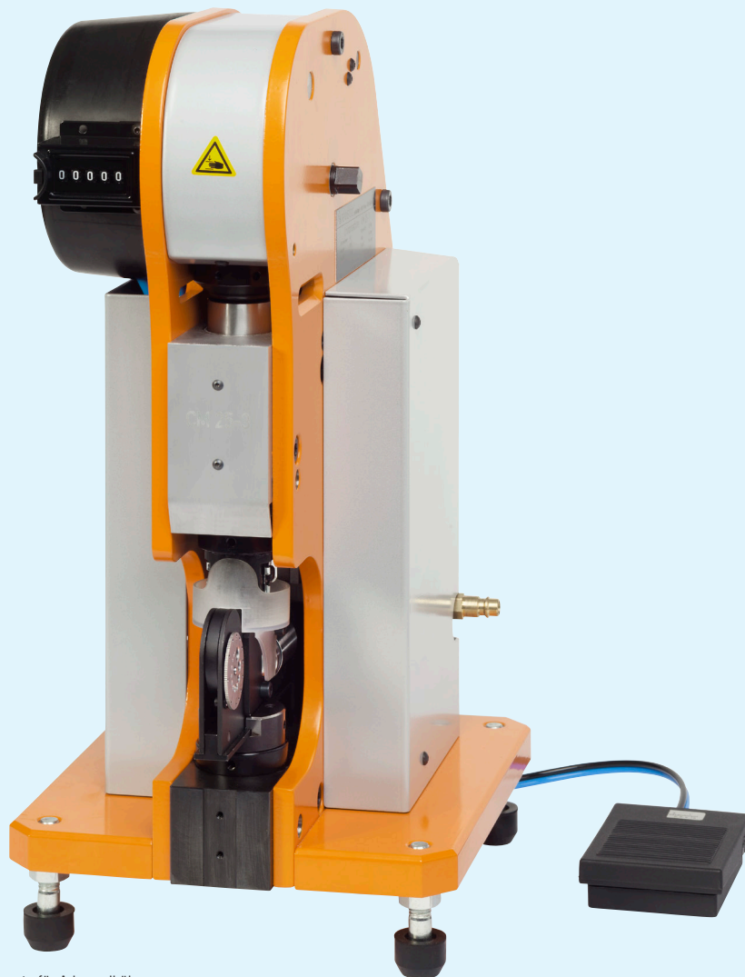
Pneumatische Crimpmaschine Modell CM 25-3 mit Einsatz für Aderendhülsen Pneumatic crimping machine model 25-3 with crimp unit for ferrules