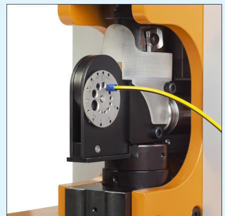
hohe Arbeitssicherheit bei guter Zugänglichkeit convenient and safe access for operation