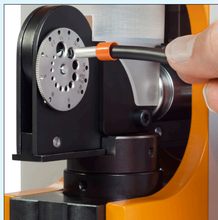
verstellbare Einführhilfe und Tiefenanschlag adjustable insertion aid and length stop